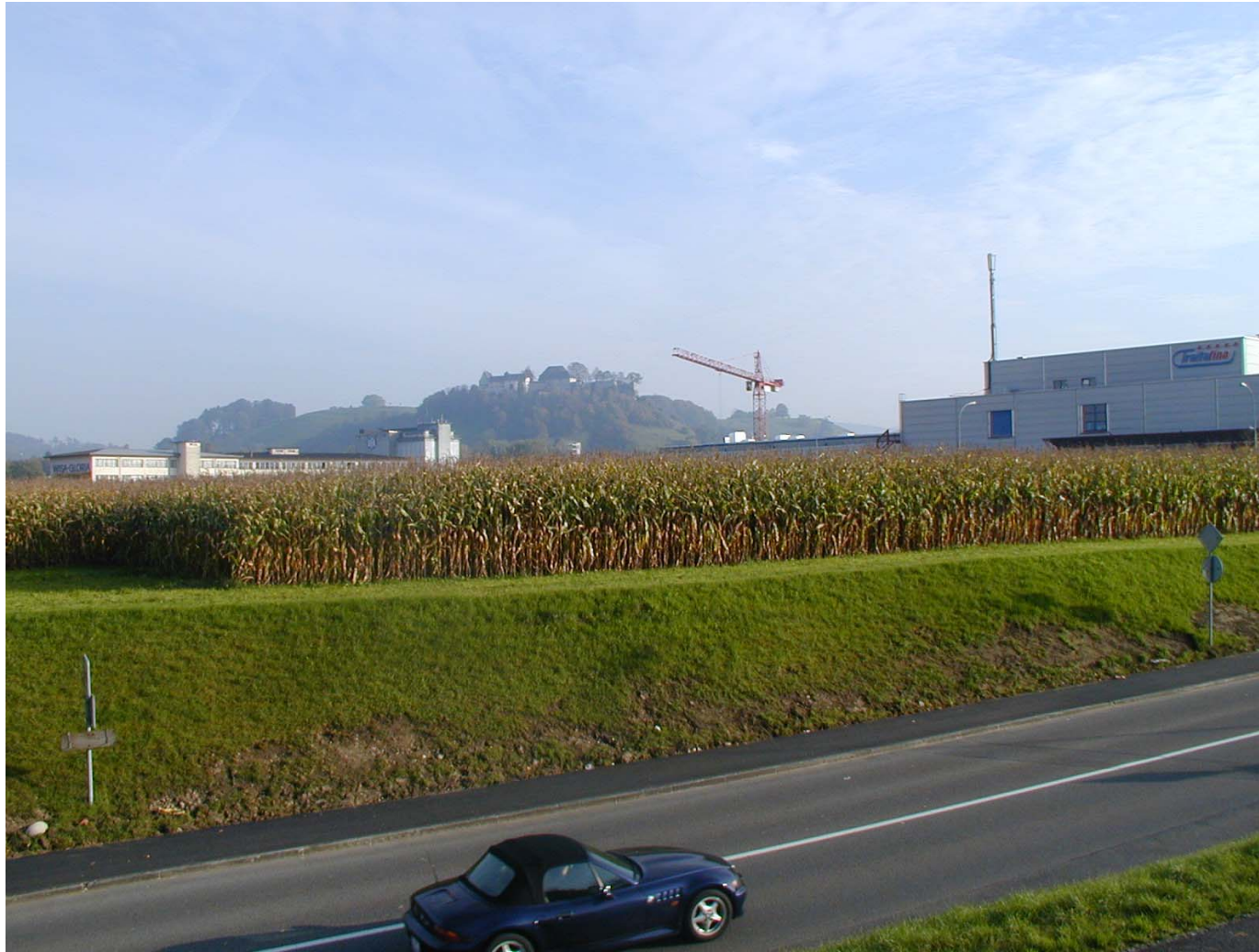
Blick aus der Industrie Lenzburg Hintergrund Schloss Lenzburg, Traita fina und Wisa Gloria