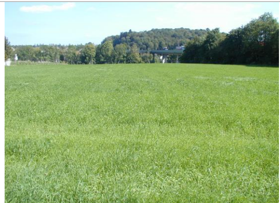
Blick Richtung Osten Hintergrund Autobahnviadukt A1