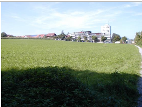
Blick Richtung Norden Hintergrund Ortsrand Niederlenz