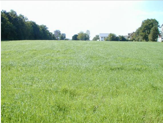
Blick Richtung Westen Links Autobahn A1 Hintergrund Staufbergstrasse Niederlenz