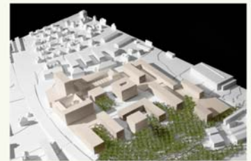
Planung vom 1. Februar 2010

Plan Volumen und Freiräume mit Schnitt West-Ost