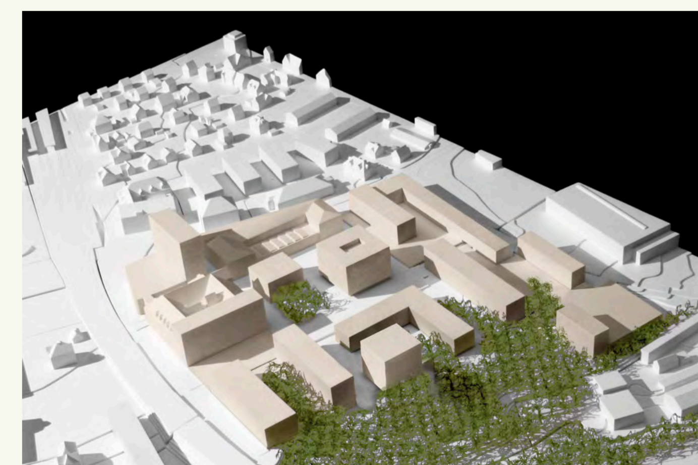
Fassung vom 1. Februar 2010